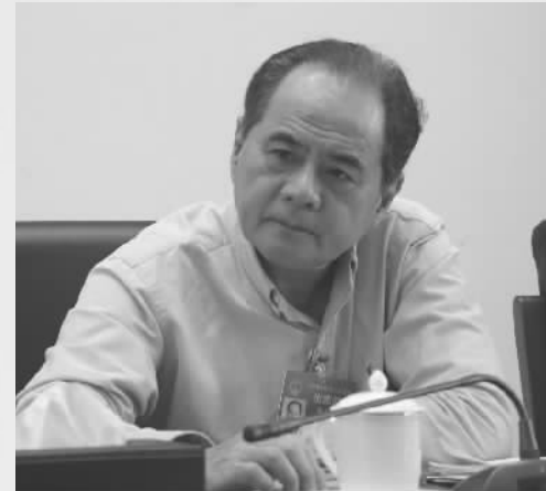
全国人大常委会委员、民革中央副主席邓力平

去年在以习近平同志为核心的党中央坚强领导下,在习近平新时代中国特色社会主义思想指导下,全国人民砥砺奋进,人民政府有力作为,经济社会发展主要目标任务圆满完成,决胜全面建成小康社会取得新的重大进展。这充分体现了党对经济工作的全面正确领导,体现了社会主义市场经济的强大生命力。新的一年减税降费决心和力度非常大,持续走出中国特色减税降费之路,建议注重政企有效配合,一起办成办好这件大事。