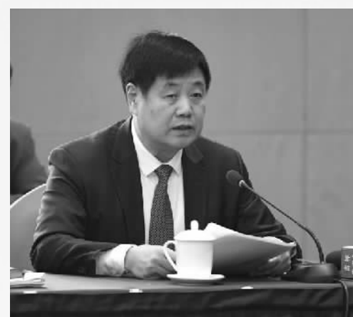
全国人大常委会委员、民革中央副主席张伯军

今年政府工作报告令人鼓舞、发人深省、催人奋进。2018年中共中央、国务院果敢决策,下决心实施减税降费政策,稳步推动实体经济发展。2019年工作部署方面,首次把就业优先政策置于宏观政策层面,体现了重视就业、支持就业的导向。在发挥消费作用方面,建议进一步扩大内需,研究释放内需的政策和措施。