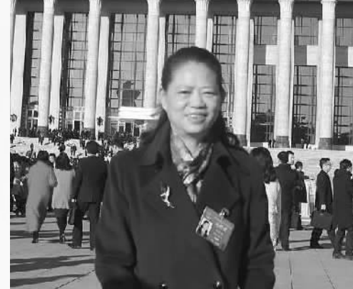
全国人大常委会委员、民革中央副主席田红旗

对营商环境方面的法律法规进行修订,解决其中的矛盾和滞后问题;强化信息化顶层设计,实现资源共享、信息安全;深化“放管服”改革,推动“非禁即入”落实,加快实现一网通办、异地办;降低融资成本,加大对民营和小微企业贷款,清理规范银行、中介服务收费,降低隐性成本;依法处理好“僵尸企业”。