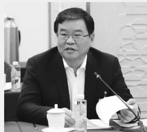
全国政协常委、民革中央副主席何报翔

李克强总理在政府工作报告中指出,“就业优先政策要全面发力”“必须把就业放在更加突出的位置”。在经济增速放缓、结构加快调整的关键时期,就业的“稳定器”作用尤其重要。要以改革稳就业,推动经济与社会体制改革、社会保障与劳动就业良性互动,实现同频共振、协调发展。要完善积极就业政策体系,提高政策瞄准的精度和实施的力度。