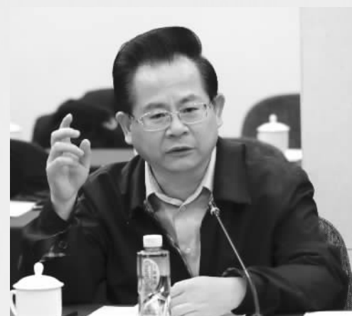
全国政协常委、民革中央副主席刘家强

去年在以习近平同志为核心的党中央坚强领导下,在习近平新时代中国特色社会主义思想指导下,全国人民砥砺奋进,人民政府有力作为,经济社会发展主要目标任务圆满完成,决胜全面建成小康社会取得新的重大进展。这充分体现了党对经济工作的全面正确领导,体现了社会主义市场经济的强大生命力。新的一年减税降费决心和力度非常大,持续走出中国特色减税降费之路,建议注重政企有效配合,一起办成办好这件大事。