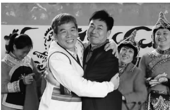
台湾少数民族代表(前左)与大陆代表达成协议后拥抱。

⑥建立两岸少数民族文化交流基地。全面交流、展示各民族文化传承。台湾少数民族各族文化传统丰富多彩，歌舞服饰雕塑饮食手工艺品都独具特色，生活形态丰富多彩，希望大陆提供更多展示的机会和平台。在都市区和一些少数民族自治区设立台湾