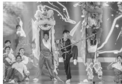
两地同胞联合表演武术舞狮。

据中新网报道 《山歌好比春江水》《娜鲁湾情歌》《瑶族舞曲》《我们都是一个人》……4月12日，伴随着一组颇具广西和台湾民族风情的组曲，“中华民族一家亲 相约壮美新广西”——2019年桂台各民族欢度“壮族三月三”大联欢在广西南宁拉开帷幕。