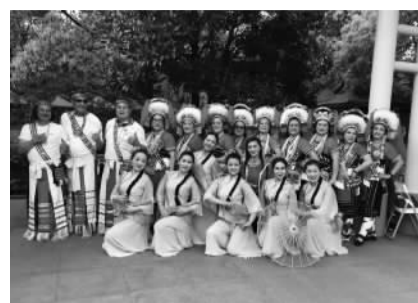
两岸民间舞蹈团姐妹合影。

据新华社报道 闪亮的遮阳帽、T恤和牛仔裤，极富活力和节奏感的舞姿。如果不细看，人们不会发现在舞台上跃动的是一群平均年龄接近60岁的台湾女性。