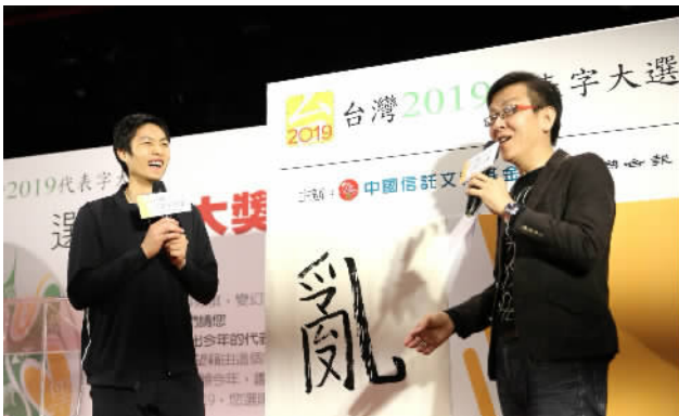
图为台湾羽毛球运动员周天成(左)现场书写台湾2019代表字“乱”。

本报综合报道 12月6日,经过24天的民众票选,“台湾2019代表字大选”结果在台北公布,“乱”字在42个候选字中拔得头筹,获选为年度代表字。值得关注的是,2008年台湾首届“代表字大选”第一名也是“乱”字,这是“台湾代表字”选拔历经12届,首次出现重复的代表字。台湾《联合报》对此发出感叹“台湾又‘乱’了!”。