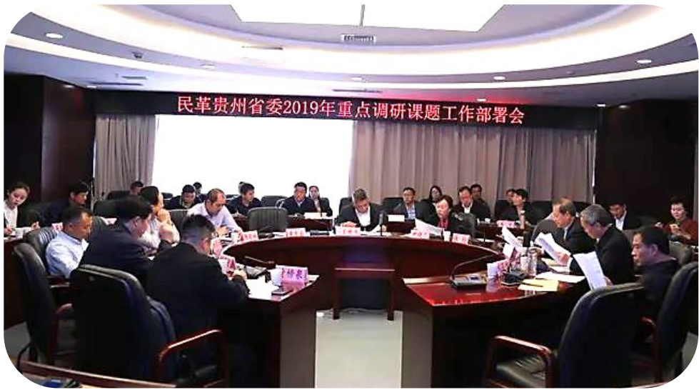
2019 年 4 月 10 日,民革贵州省委 2019 年重点调研课题工作部署会在贵阳召开,贵州省副省长、民革贵州省委主委王世杰出席会议并讲话。

本报石家庄讯 1 月 2 日,在河北省两会召开前夕,记者了解到民进河北省委会“构建河北省“一路一河”全域旅游新格局”提案受到河北省副省长的高度重视,批示河北省 21 个县市(市、区);太行山高速公路主要位于河北省西部,依次穿越张家口、保定、石家庄、邢台、邯郸 5 个市,途经 19 个县(市、区)。民进河北省委会在调研时发现,太行山和大运河区域是河北省重要的文化聚集区、旅游资源聚集区,太行山区还是重要的生态环境支撑区。但现实存在着旅游个体规模小、分布散,缺少知名龙头景区的问题。如果以“一路一河”为纽带,统筹谋划,高端布局,深入挖掘文化内涵,加强文旅融合,打造旅游廊道、文化廊道、生态廊道、经济廊道,形成河北“一路一河”旅游品牌,对于推动河北省全域旅游发展,实现乡村振兴,建设经济强省、美丽河北具有重要意义。 立足河北,放眼望去。李建强充满信心地说,一路是联接东北三省、内蒙古、京津通往山西及西北各地的旅游大通道,也是全国自驾游的热线。而一河处于东北京津通往山东,及东南的旅游热线。“一河一路”的架构,能让河北借势发挥本地旅游资源,争取更大发展空间。由此,民进河北省委会将“打造‘一路一河’文旅融合品牌”作为 2019 年度重点课题立项。 为提出有价值的意见建议,民进河北省委会联合“一路一河”沿线 8 个民进市级组织及河北经贸大学旅游学院内专家,组成调研