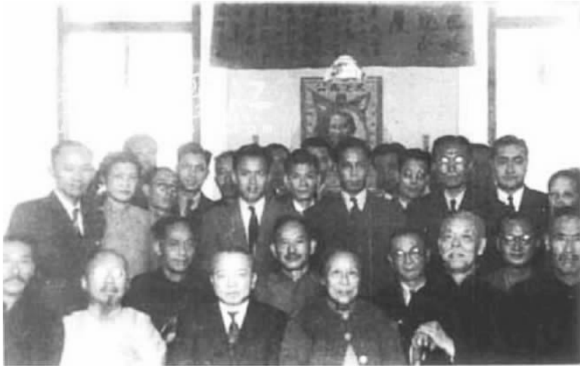
1948 年 1 月，民革中央部分领导人在香港合影。左起：朱蕴山、柳亚子、蔡廷锴、李济深、张文、何香凝、彭泽民、王葆真。