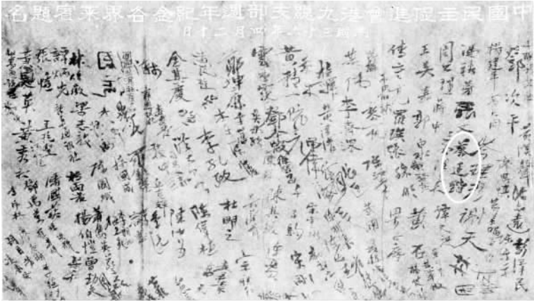
蔡廷锴参加中国民主促进会成立一周年时签名

之后，蔡廷锴所部随叶挺、贺龙参加南昌起义，任军事委员会委员、第十师师长兼右翼总指挥等职。南昌起义失败后，率所部转入福建。之后其部接受蒋介石的改编，蔡任第六十师师长。新军阀的混战和国民党内的派系纷争，攘权