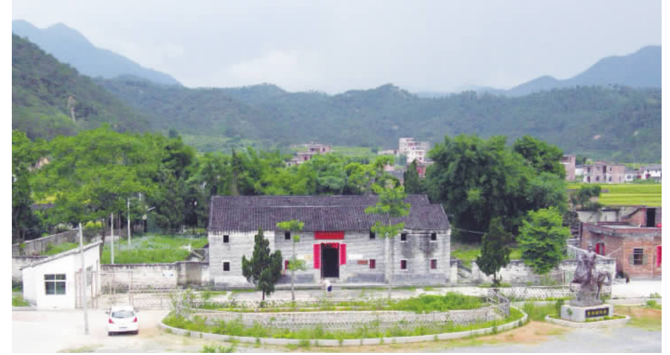
广东罗定蔡廷锴故居

蔡廷锴率领十九路军奋起抵抗日寇侵略的淞沪抗战，是中国军队首次坚决抗击日寇侵略的大规模战役，表现了中华民族坚决抗击外来侵略的不屈民族意志，振奋了全国军民的抗日精神。蔡廷锴由于不顾南京政府当局的指示，在日寇侵犯我国土之时，毅然率领十九路军奋起抵抗，给予日本侵略者沉重的打击，获得了全国人民的崇敬和赞颂，赢得了抗日名将的英名。 （作者系天津师范大学历史学院、马克思主义学院教授）