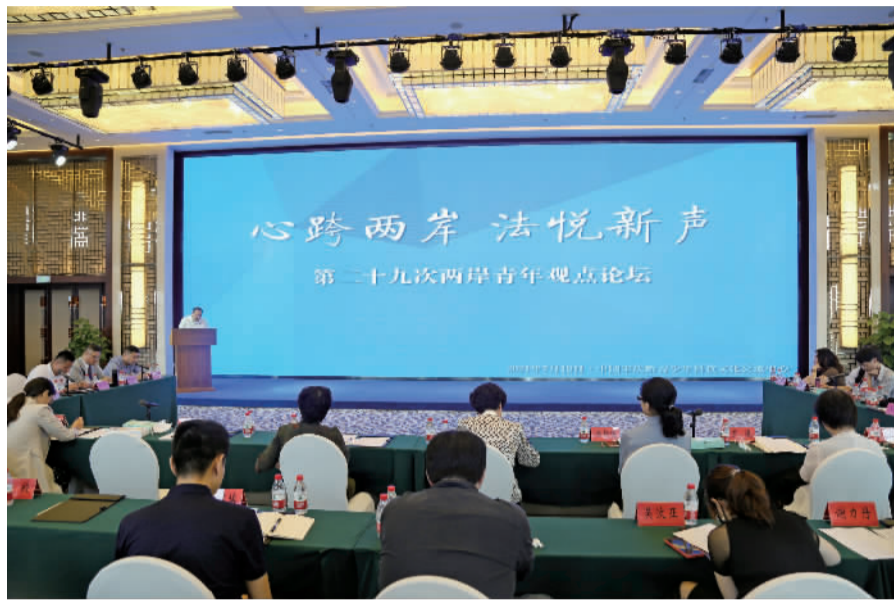
▲第二十九次两岸青年观点论坛现场。

7月19日,以“心跨两岸·法悦新声”为题的第二十九次两岸青年观点论坛在中国宋庆龄青少年科技文化交流中心拉开帷幕。论坛上,10位来自法律领域的两岸青年精英分享观点、经验,交流行业现状,共谋两岸法律合作加强之道。