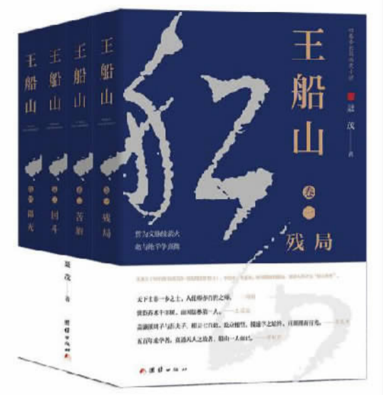
《王船山》 作者：聂茂 出版单位：团结出版社 出版时间：2024年6月

四卷本长篇历史小说《王船山》，聚焦王船山的生平，塑造了以王船山为代表的衡州学子群像，并将南明历史巧妙地融入其中，充分展示王船山历九死而未悔的艰难人生。该书一经出版，便受到业内媒体关注和众多读者好评，入选多个好书榜单，并先后在衡阳市图书馆、王船山故居、湖南省委大院开展新书首发式、捐赠及专题讲座活动，取得良好的社会反响。