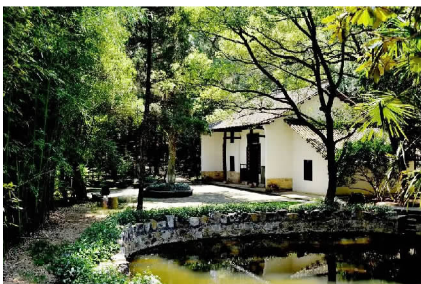
位于王船山故居的湘西草堂，其正厅画像两旁的对联“六经责我开生面，七尺从天乞活埋”，讲述着王船山的毕生追求。

为，王船山是启蒙思想家、唯物主义思想家，开启了中国近代的思维活动，可与德国近世的理性派思想媲美。熊十力认为，王船山是崇尚宪政民主的理学家，“儒者尚法治，独推王船山”，可与孟德斯鸠媲美，而王船山易学体系“足为近代思想开一路向”。冯友兰认为，朱熹与王船山是宋明道学史上前后并驾齐驱的高峰。萧