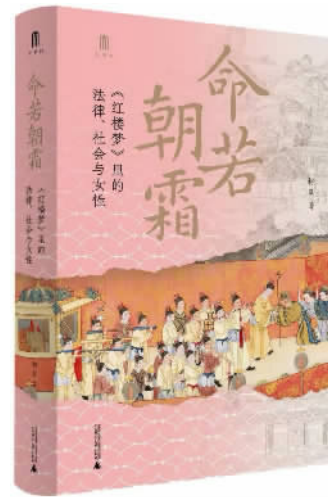
作者：柯岚 出版单位：广西师范大学出版社 出版时间：2025年1月

法融入良民百姓中，只好悄悄到民间重操旧业。由于法律限制女伶人登台，她们不敢到城市公开演出，只能在乡间流动演出。不但收入低微，而且经常被官府驱逐，被地痞流氓欺辱，无法过上正常人的生活。法律，不但没有保护她们，反而让她们陷入更多的烦恼之中。