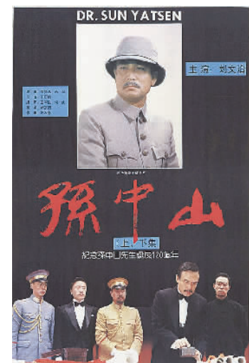
电影《孙中山》(上、下)海报

为了拍好这部影片,丁荫楠阅读了“一千多万字”的有关孙中山先生的史料,提炼出“牺牲”这一悲剧美的主导意蕴,并贯穿全片。影片中,孙中山白发渐多,感叹“我真的老了,总睡不着,不断做梦”,悲愤地发出“我还能重新开始一次吗?”的疑问,然而当冯玉祥邀他北上,他有可能重新开始一次时,他竟撒手人寰了。影片的结尾,1924年,冯玉祥在北京发动政变,电请孙中山北上主持国事,孙中山此时已肝病甚重,但仍赴京。北京民众伫立在寒风中欢迎孙中山,孙中山坐在藤椅上,被抬进人群里,他回眸看向人们,眼神中充满了惜别之意。