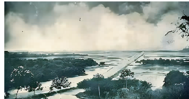
中山公路 二十世纪初的广州

1993年5月,澳门将宋玉生博士圆形地至亚利雅架圆形地一段更名为孙逸仙博士大马路;90年代,澳门半岛新辟的海滨马路命名为孙逸仙大马路。香港虽没有以孙中山命名的街道,但在2018年,为配合孙中山纪念馆启用,将一条中山史迹步行径更新地标,更名为孙中山史迹径,通过图片文字、艺术设计介绍史迹,还设置二维码方便游客了解更多信息。