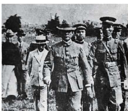
纪录片《助业千秋》拍摄的孙中山在广东韶关北伐誓师大会后检阅部队

这些海外的中山路,早已超越其地理意义,成为连接过去与未来、本土与世界的文化基因。中山路的故事还在延续,它将继续见证中华民族伟大复兴,承载全球华人的共同记忆和美好未来。