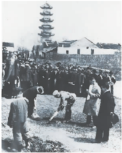
破土开工。一九二八年三月二十六日,上海市中山路