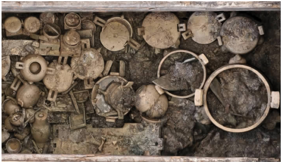
武王墩墓地是一座带园壕的大型独立陵园,面积约 150 万平方米。武王墩一号墓共出土各类文物 1 万余件(组)。

正如武王墩墓考古发掘项目领队宫希成评价该书所说:“一览武王墩墓主人考烈王波澜壮阔的一生,倾读楚国晚期图强中兴的奋起,看尽八百余年楚国最后的余晖。”《考烈王:武王墩墓主生平纪事》一书,以洋洋洒洒十五万字,清晰地还原了考烈王凭借胆识与智慧维系的楚国晚期的辉煌历史。该书的出版,为战国晚期历史研究提供了全新的视角。